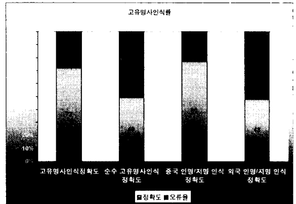
(그림 8) 인명/지명 명사 인식 정확도