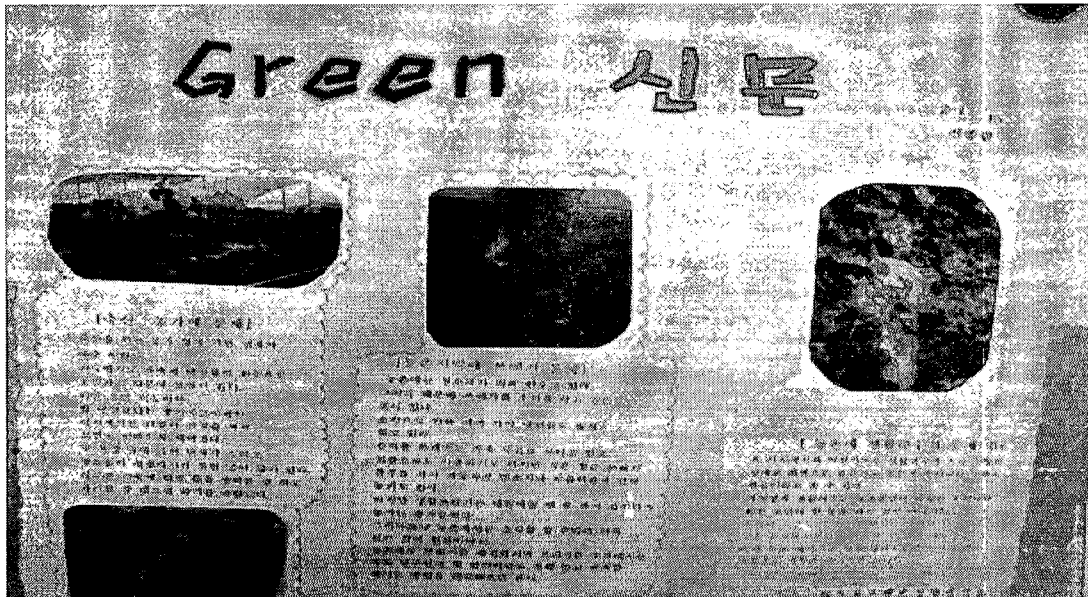
그림Ⅲ-1. 수도권 농촌지역의 현실

연구지역인 수도권 농촌지역의 심각성이 아래 그림Ⅲ-1 신문에 잘 나타나 있다. 그림Ⅲ-1 신문은 축산농가에서 배출되는 가축배설물의 문제, 폐기물의 불법 소각, 무방비 상태로 하천에 방출되는 생활하수 등 농촌지역의 환경실태를 보여 주고 있다.