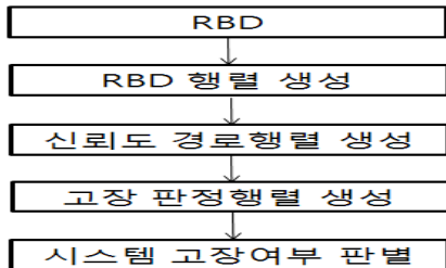
Fig. 3. The flow chart for a reliability calculation method of a system

시스템을 구성하는 모든 서브시스템들이 서로 다른 경우의 조합으로 가질 수 있는 경우의 수 조합을 구하고, 고장 판정 행렬에 의해 전체 시스템의 신뢰도 경로 중 에서 하나라도 정상이면 전체 시스템은 정상이고 신뢰도 경로 행렬의 여러 경로들 중에서 하나도 만족하지 못할 경우 시스템은 고장으로 판정한다. 고장 판정 행렬이 신뢰도 경로 행렬에 대하여 정상 여부 판정은 신뢰도 경로 행렬상의 모든 성분 노드들에 대한 곱이 1인 경우이다. 시스템이 정상인 모든 경우에 대한 확률을 다 더한 값 또는 시스템이 고장인 모든 경우에 대한 확률을 다 더한 값에 1을 빼 값이 시스템의 신뢰도가 된다. 이러한 신뢰도 경로 행렬 전개 방식기반의 시뮬레이션 기법을 이용하면 어떠한 시스템에 대해서도 서브시스템의 신뢰도를 알 때 전체시스템의 신뢰도를 추정할 수 있다. 시스템 신뢰도 계산 방법에 대한 전체 흐름도는 <Fig. 3>에 나타내었다.