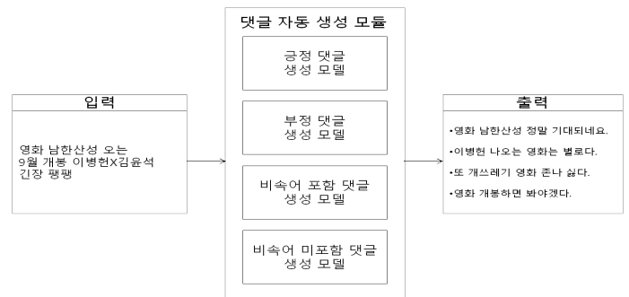
그림 1. 감성을 고려한 댓글 생성 모델

감성을 고려한 댓글을 자동 생성하기 위해 그림 1과 같이 네 가지 감성 유형의 모델을 사용한다. 각 모델의 입력은 기사 제목과 첫 문장이며, 출력은 입력을 토대로 감성 유형에 맞게 생성된 댓글이다.