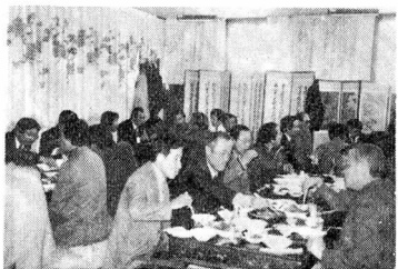
▲민속음식점「새집」에서 회원및 내빈의 오찬광경

한편 본회 吳사무국장의 협회현황 설명등으로 총회를 끝내고 현판식을 가진 후 오찬을 겸한 의견 교환과 사적지답사가 있었으며 선임된 임원은 다음과 같다.