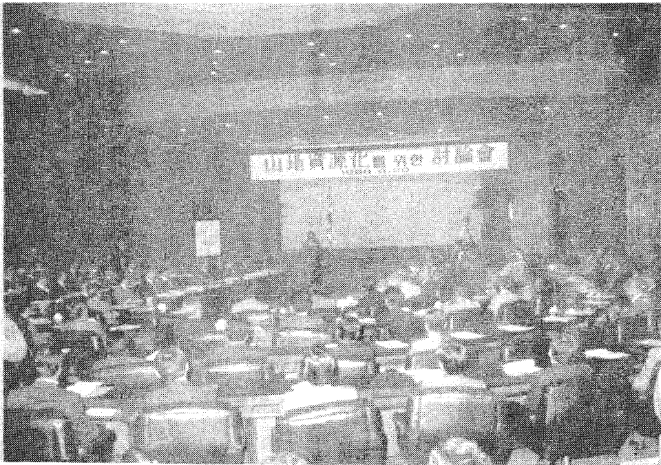
산지 자원화를 위한 토론회 광경