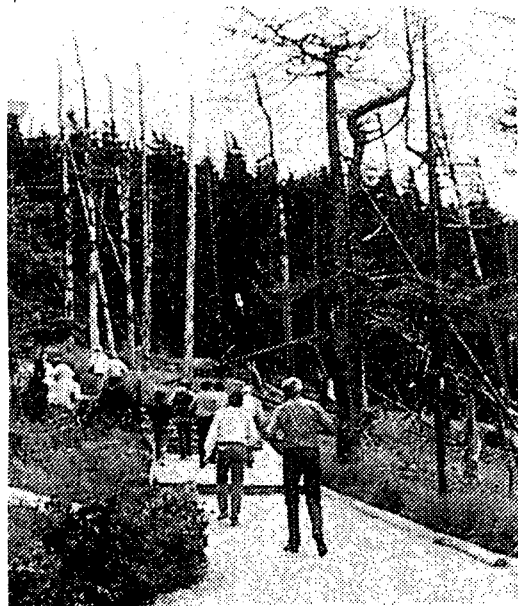
▲ 산성비의 피해를 입은 미셀산 (미국 로스켄로니아주)에서 조사를 하고 있는 WRI의 연구원.

금년은 일본정부가 UNEP(유엔환경계획)와 공동으로 주최하여 9월11일부터 개최되었던「지구환경보전에 관한 동경회의」에서 토론된 각종 정책론의 기초안을 작성하는 작업을 수주하기도 하였다.