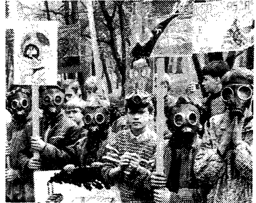
▲ 폴란드 술레지엔 학생들이 카토비체시에서 시위를 하고 있다.

의 캐세이패시픽 여객기는 기내방송을 통해 공해방지의 메시지를 전달하고, 홍콩의 힐튼호텔에서는 초록색 초코렛을 판매하기도 했다. 네팔의 환경전문가들은 이날 농부들을 제몽하기 위해 시골지역을 방문했다. 이모든 행사는 지구의 생명을 지탱해주는 물질이 소멸되고 있음을 경고하고 더 늦기전에 지구를 깨끗하게 지켜나가야함을 알리기 위한 것이다.*