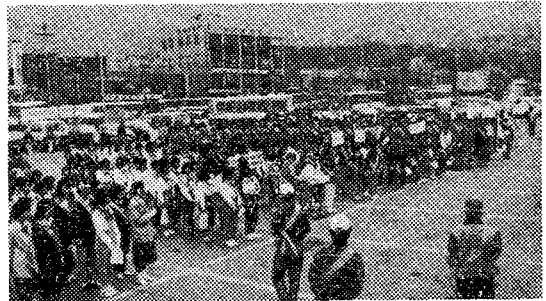
▲ 환경보전 공동캠페인 현장