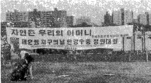
△ 대회장에 걸린 현수막