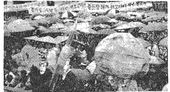
△ 공해추방을 상징하는 모형물들