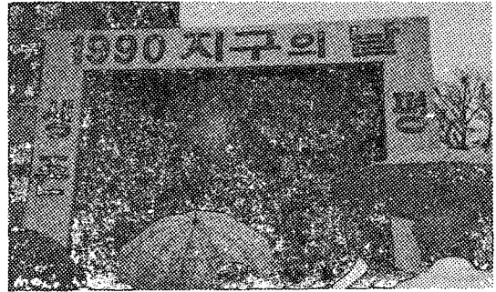
△ 남산 행사장 전경

당)에서 열렸다. 이날 행사는 '하나뿐인 지구, 하나뿐인 국토, 하나뿐인 생명'을 주제로 ▲ 각계의목소리 ▲ 공해피해자의 고발 ▲ 선언문 낭독 ▲ 시낭송 ▲ 노래와 춤 ▲ 대동놀이 ▲ 코미디 ▲ 강좌 ▲ 환경서약등으로 이루어졌다. 시민들이 직접 참여하는 행사로는 ▲ 환경포스터 그림대회 ▲ 안쓰는 물건 바꾸기 ▲ 유기농산물장터등이 열렸다. 또 주최단체는 가족과 함께온 어린이 1천9백9십명에게 지구의 날을 기념하는 '평화의 지구본'을 선착순으로 나누어주기도 했다. P14는 김지하시인이 초안한 「1990 지구의 날 선언문」전문이다.