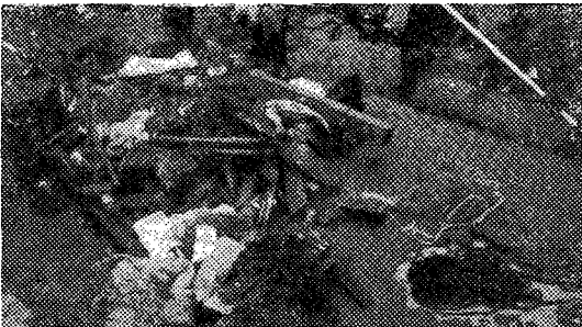
▲ 잠수부가 건져올린 수중쓰레기들