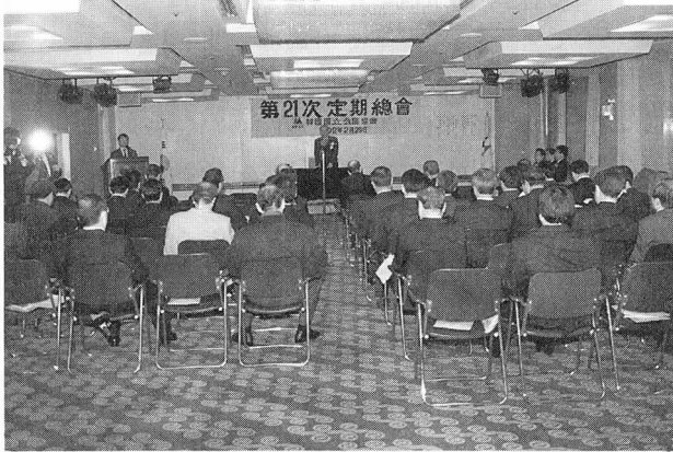
92年度(第21次) 定期總會 光景

本會 92年度(第21次) 定期總會가 지난 2月29日 오후 2시부터 5時45분까지 프레스센터(서울 중구 태평로 1-25) 19층 기자회견장에서 대의원 99人中 58人 이 參席(위임 20)한 가운데 개최되었다.