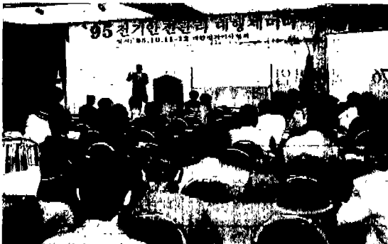
▲ '95 전기안전관리 대행 세미나

60여명의 임직원이 참가한 이번 행사는 전기안전관리 선·해임 확인요령과 전산교육, 체력단련 행사(등반)를 병행하여 직원들의 단합과 화합의 장의 기회를 부여, 협회 발전의 계기가 되었다.