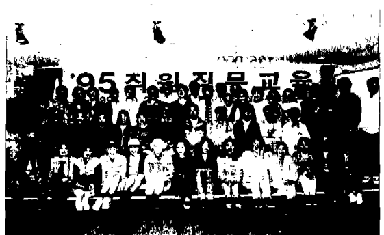
▲ '95 직원 직무교육