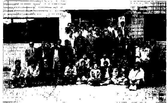
▲ 화력수력발전소 방문 기념사진