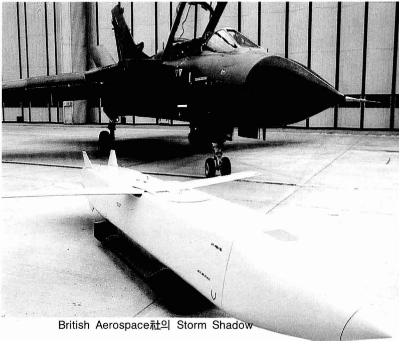
British Aerospace社의 Storm Shadow

system, 탄두, 신관 및 항해장비 및 탐색기 헤드로 구성되어 있다.