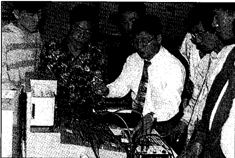
◀산·학·연이 협력한 하나의 연구의 장에서 함께 공유하며, 함께 참여하는 공동연구소의 모습.

부터는 CATV 수신기에 EMS를 적용할 것을 결정하고 규제를 강화해 가고 있다. EU는 1996. 1. 1 부터 유럽회의가 제정한 EMI / EMC에 관한 지침서상 기술기준에 적합한 제품만을 역내 유통을 허용하고 있다. (대상품목: 모든 전기 / 전자제품). 일본 역시 전기용품취체법에 의해서 가전제품에 대한 EMI 검사가 의무화되고 있으며, 통상성과 우정성은 공동 작업으로 1994. 5 월 가전범용품 고주파 억제 대책지침서를 제정하였고, 1998. 1월부터는 EMS에 대한 규제를 실시하도록 하고 있다. 우리나라에서도 전기용품안전관리법에서 규정한 바에 따르면 184개 품목이 전자파장해 검정을 의무적으로 받도록하고 있으며, 또한 전파법이 규정한 바에 따르면 1997. 1월부터는 구내교환기, 컴퓨터 등 유선통신기기와 정보기기 25개 품목이 전자파장해에 대한 검정을 받아야 하도록 규정하고 있다. 이 밖에도 통산부와 정통부는 이미 EMS 기술기준 및 평가방법의 제정을 공동작업으로 추진중에 있다. 이와같이 전자파장해에 대한 국내외 시장의 규제가 날로 강화되고