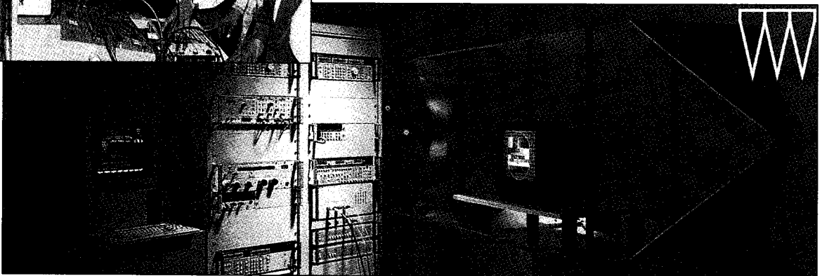
▼ TV수상기의 전자파내성 측정(EMS)