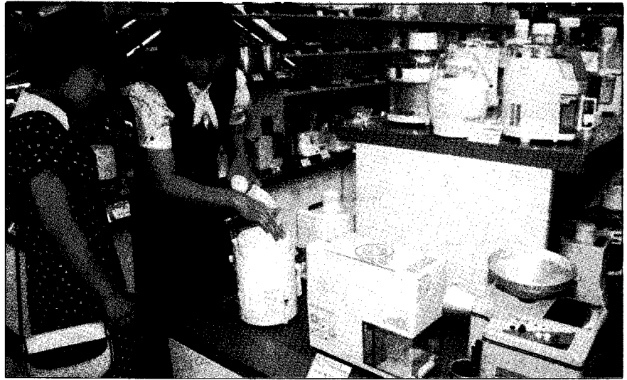
▼ 판매사원이 상품에 대한 충분한 지식으로 고객에게 제품 설명을 하고 있다.

지 기능을 준비할 수 있는 것은 수반되는 비용이 디스카운트 스토아보다는 높은 가격으로 책정되는 상품가격에 반영될 수 있기 때문이다.