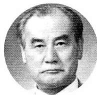
오 판 용 < 본회사사 >

사람이나 풍설해(風雪害)로 인한 나무의 상처를 보면 누구나 안타까움을 금할 수 없다. 그런데 산에 가서 나무들을 세심히 관찰해보면 별난 수난을 받고 있는 안타