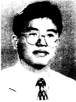
온 기 운