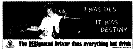
영국 주류업계의 음주운전 예방홍보 포스터

1980년대 초반, 축구장에서 취객들의 난동이 발생하여 다수의 사상자가 발생한 이후에 스코틀랜드 법원은 술을 운동장과 운송수단 내에 반입하지 못하도록 금지했다. 잉글랜드와 웨일즈도 이러한 조치에는 동조를 하였다. 일부지역에서는 거리에서의 음주도 금지하게 되었다.