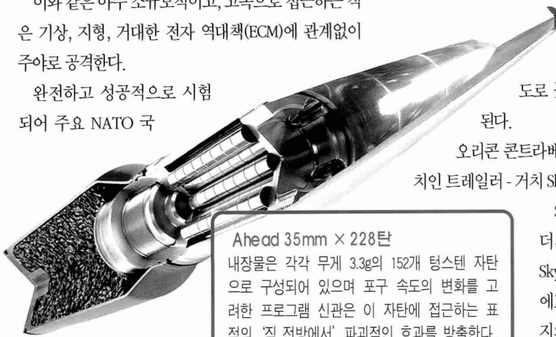
Ahead 35mm × 228탄

Skyguard III는 3D I-band 레이더의 이중 방식(dual mode)이고 Skyshield 35 방공체계의 감지장치에도 사용되었고 -5°에서 +70°까지의 고저각과 완전 360° 주사하는 특징이 있다.