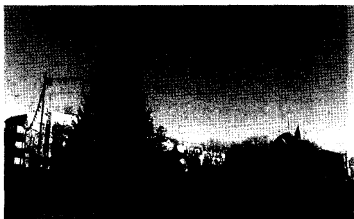
러시아의 추운 겨울은 러시아인들에게 술을 권한다

추위가 길고 깊은 러시아는 자연자체가 술을 권한다. 그렇지만 광대한 러시아에는 서로 다른 국적을 가진 사람들이 살고 있고 문화가 다양한 인종집단이 아주 많다. 재미있는 것은 국적이 다르거나 인종이 다를 경우 술을 마시는 방식, 주량, 음주시점, 의학적인 문제나 사회문제 등이 모두 다르게 나타난다는 것이다. 예를 들어 러시아 북방에 사는 사람들은 알코올을 마시는 방식과 대사능력이 다른 곳의 사람들과 다르다고 한다. 북방에 사는 러시아 원주민들은 일반적인 러시아인들에 비해 알코올 중독이 3배내지는 6배까지 높게 발생한다. 북방 원주민들은 목축업이나 수렵업에 주로 종사하고 있는데 눈병과 췌병이 많은 것으로 알려져 있다.