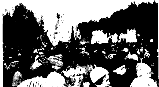
전통의례 “마슬레니짜”에서 음주가무를 즐기는 러시아인들

이러한 상황은 주류판매업자의 권한 남용을 가져왔고, 시민들은 이를 증오하게 되었다. 급기야는 폭력사태도 발생하였고 절주운동이 나타날 조짐을 보였다. 그런 과정을 거쳐 1863년에 알코올의 모든 생산과 교역에 대해 주세를