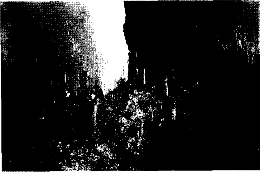
러시아인들이 남녀를 불문하고 즐기는 보드카

생각이 든다. 러시아에서 40%짜리 보드카가 특히 애호를 받지만 우리나라에서는 22-25% 짜리 소주가 애주가들의 사랑을 받고 있어 취향상 차이도 비슷해 보인다. 또한 주량이나 음주 방법, 음주 후 결과에 대한 태도 등에서도 많은 유사점이 발견되어 흥미롭다.