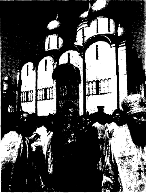
988년 음주를 허용하는 그리스정교를 국교로 도입 러시아정교가 출범

우리나라의 고려시대에 사원에서 술 제조권을 가지고 있었던 역사적 사실과 전혀 다르지 않다. 수도승들이 너무 많이 마셔서 종교회의에서 수도원 내에 특별 감옥을 설치하기도 했다. 만취한 수도승들에게 수갑과 족쇄를 채우고 금주교육을 시켰다는 자료가 있어 중세 러시아의 수도원에서 이미 알코올 남용 및 의존에 대한 적극적 대책이 시작되었음을 엿볼 수 있다.