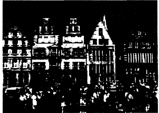
600여종의 포도주를 마실 수 있는 브레멘 시청 지하 술집

즉, 독일의 펍은 산업화가 진전된 이후 노동자들의 휴식장소였던 것이다. 펍이 '가난한 자들의 사교장소'라는 것은 영국이나 독일이 유사하였다.