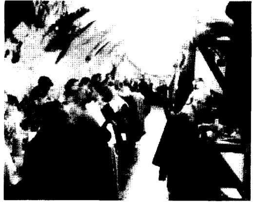
독일 맥주집의 내부

영역을 침범했거나 허용되지 않은 일을 시도한 것이 된다. 독일의 펍에는 문자화되지 않았지만 지켜지는 법칙들이 여전히 존재한다고 한다. 그런데 그 중 금기들은 대체로 여성에 대한 것이라고 한다.