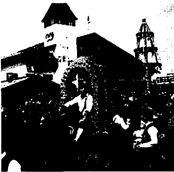
독일 뮌헨의 맥주축제

독일의 음주문화는 그야말로 대폭 개선되었다고 보는 것이 옳을 것이다. 펍에서 서로 소리치기는 하지만 격렬한 싸움까지 벌어지는 경우는 드물다. 1800년대 초기의 노동자들의 음주형태와 비교해 보면 많은 변화가 있었다는 것이다. 그 당시 독일의 펍에 대해 기술한 자료를 보면 술집에서 싸우는 것은 오히려 정상적인 일이었다고 적혀있다.