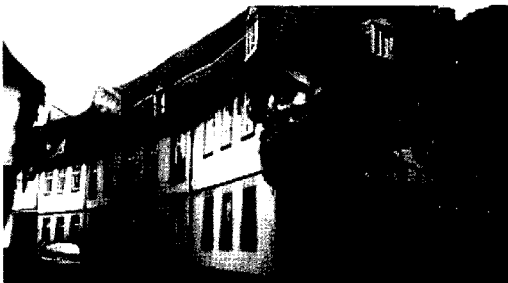
프랑크푸르트에서 생맥주를 마시는 명소 베티스

독일 남성과 여성의 음주유형자 비교 결과를 보면 그 차이가 분명하게 나타난다. 술을 안 마시는 여성이나 1년에 1-2잔정도 입에 대는 여성은 32%, 남성은 그러한 사람이 13%에 불과하다. 한편 과음하는 남성은 44%이고 4명 중 1명이 매우 많이 마시는 사람들이다. 어느 나라나 상습음주자들이나 문제음주자들은 조사할 때 음주량을 낮게 적는 것을 감안한다면 실제로는 이보다 더 많은 사람들이 주량으로 볼 때 문제음주자라고 할 수가 있다. 결론은 독일 남성들은 술을 많이 마신다는 것이다. 그리고 그들은 맥주를 즐겨 마신다.