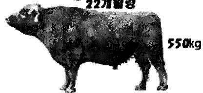
〈표 5〉 자연종부와 인공수정 생산우의 발육 및 경제성 비교