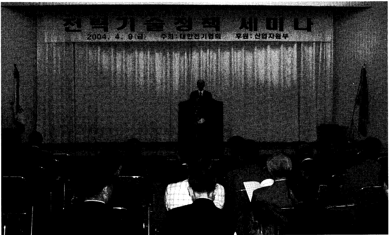
전기의 날 기념 '전력기술정책 세미나'

대한 전기협회는 국가산업발전과 경제발전의 원동력인 전기의 지난날을 되돌아보고 그 의미를 선양하기 위하여 제정된 '전기의 날'을 맞아 '전력기술 정책 세미나'를 4월 9일 오후 2시부터 한국전력공사 을지로 별관 강당에서 개최했다.