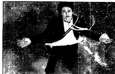
광고 2. KT&G TV-CM <소녀의 사랑>편