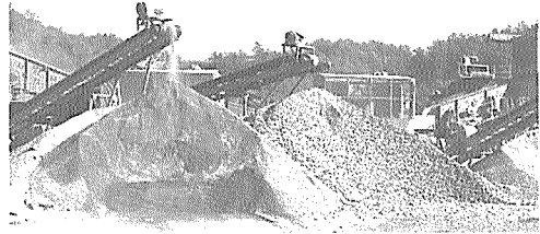
순환골재의 품질인증 및 관리에 관한 규칙

에 관한 규칙'에는 앞으로 건설폐기물의 중간처리업의 허가를 받은 업체가 골재를 생산·판매할 때에 정부로부터 품질인증을 받기 위한 기준, 관리방법 및 절차 등에 관한 사항을 규정하는데 그 목적이 있다.