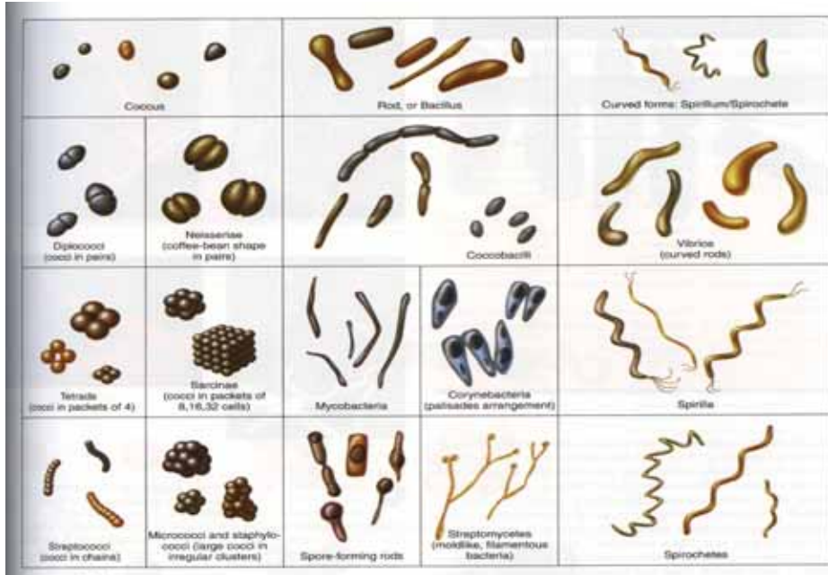
그림 2. 형태별로 구분한 세균의 배열