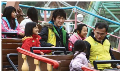
육아원 아이들과 놀이동산 나들이