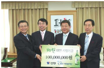
맑은린 사랑기금 기부