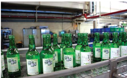
생산중인 숲속에서 맑은린

또한 청담은 엄선된 쌀을 원료로 하고 회전원반식 자동제곡기에서 생산된 누룩으로 발효시켜 최첨단 증류기로 증류하고, 증류직후 냉각여과로 잡미를 없애고 스텐레스 용기와 오크통(참나무통)에 10년이상 숙성시켜 원숙한 곡향의 풍미가 느껴지는 고품질의 원주를 생산한다. 이원주는 '맑을 린'의 브랜딩 원주로도 사용되고 있으며, 일본의 최고급소주 '長生'의 원주로 수출도 하고 있다.