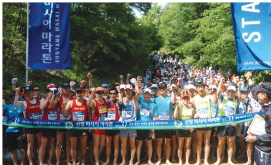
2007 선양마사이 마라톤 대회

또한 수익금의 일부를 맑은린 사랑기금으로 조성하여 지역 내 어려운 학생에게 장학금을 지원하고 있으며 대진 최초의 풀코스 마라톤대회를 준비하는 등 지역스포츠 활성화에도 기여하고 있다.