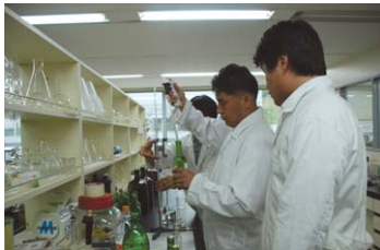
연구소 내 제품검사 모습