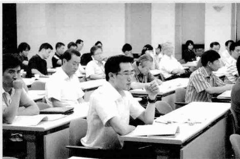
▲ 교육생들의 적극적인 교육참여가 이루어졌다.