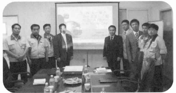
[대일전자 안전경영시스템 구축 지원을 위한 Kick-Off식]