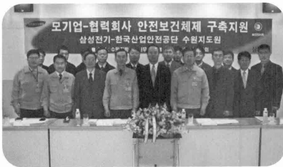
[노동부 모기업-협력회사 안전보건지원체제 구축 협약식]