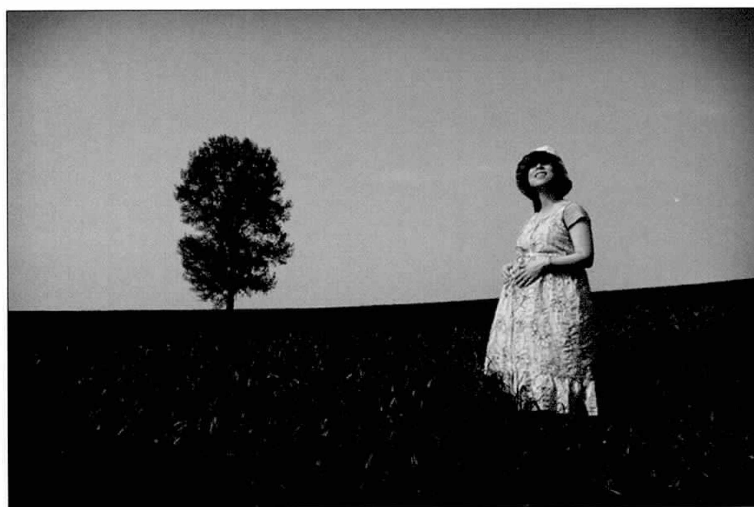
▲사진 부문 대상

또한 수상작은 작품집으로 제작·배포하고, 환경보전 홍보물 제작에 사용하는 등 국민들의 환경보전의식을 높여 나가는데 활용할 계획이다. (K)