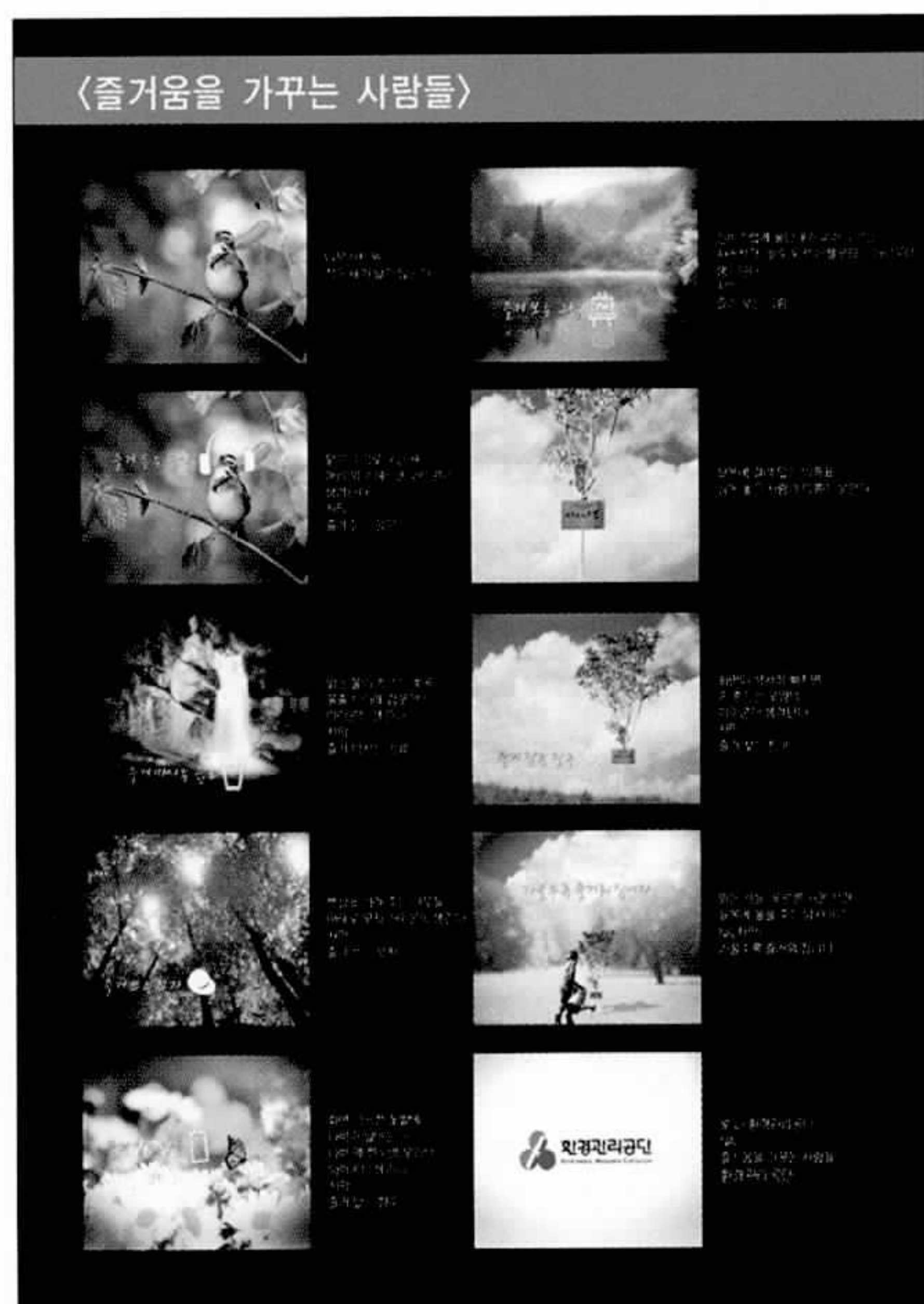
▶광고기획서 부문 대상