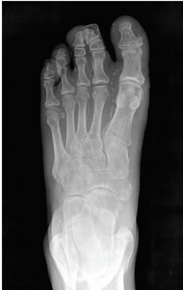
Figure 2. Diffuse soft tissue and vascular calcification of small and medium sized arteries of foot (pipe like calcium deposit) with ischemia secondary to fibrous obliteration of lumen of vessels.

좌측 제2 족지와 제3 족지는 합지증을 보였고 제2 족지의 내측에 부분적 괴사를 동반한 건성 괴저 소견 관찰되었다 (Fig. 1). 좌측 족관절 발목 상완 지수(ABI)는 0.65였으며 족배 동맥은 촉지할 수 없었다. 단순 방사선 소견상 족부내 혈관 및 연부조직의 석회화 침착 소견 관찰되었으며(Fig. 2) 혈중 검사 소견은 혈청 칼슘 9.65 mg/dL, 인 4.5 mg/dL, 혈중 요 질소 44.7 mg/dL, 크레아티닌 7.38 mg/dL이었으며 부갑상선호르몬(PTH)이 13 pg/mL로 증가된 소견을 보였다. 혈관 조영술상 제2 족지로 가는 혈류가 관찰되지 않았으며 조직검사상 동맥 내 혈관의 석회화 침착과 함께 염증