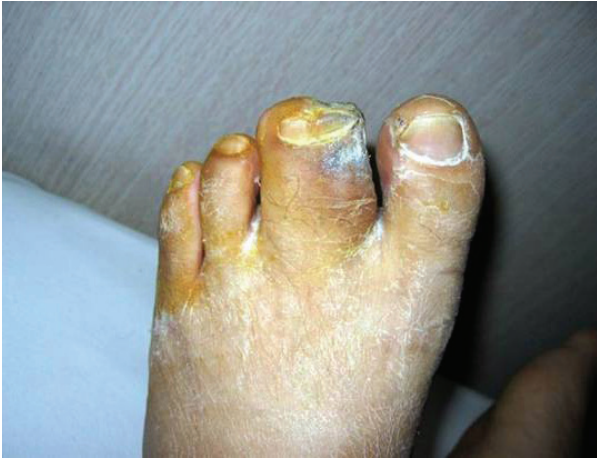
Figure 1. Gross appearance of gangrenous area of 2 nd toe of Lt. foot (syndactyly on 2 nd and 3 rd toe).