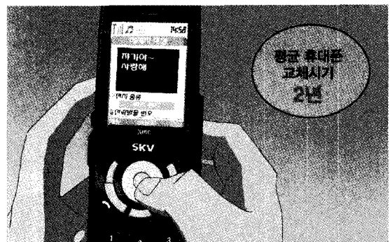
〈최우수상 "1500만대의 휴대폰 _ 안상남"〉