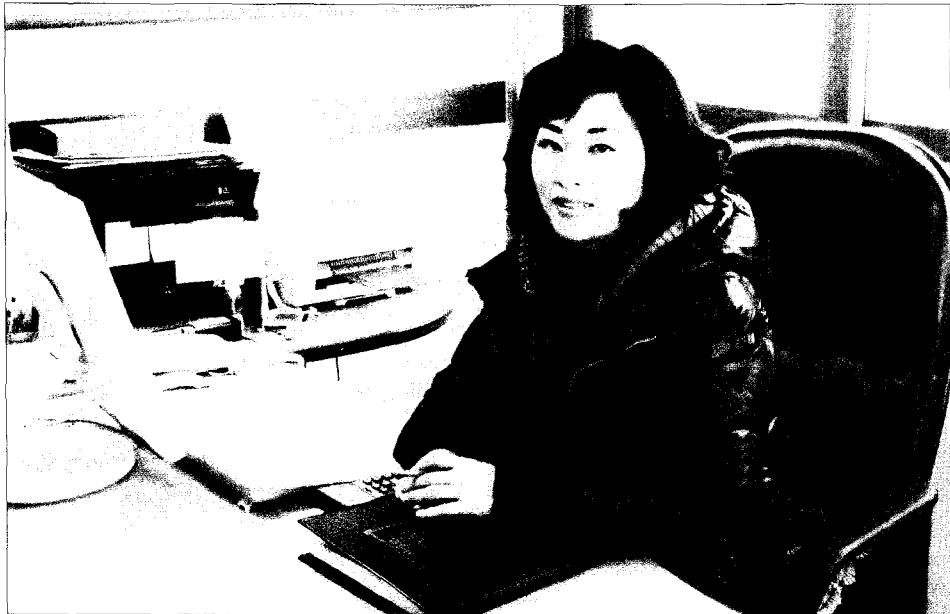
전 무 나 도 영