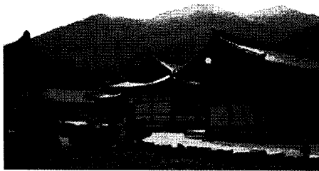
경북 청도군 소재 운문사