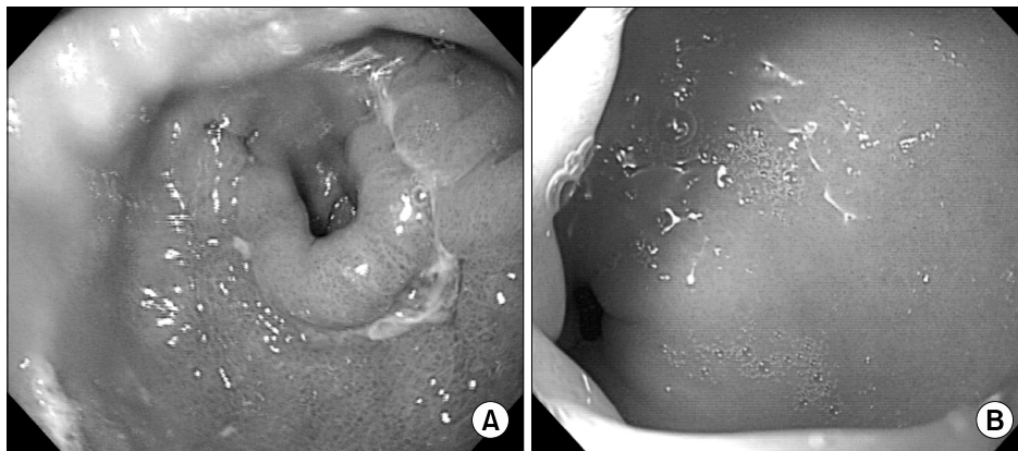
Fig. 2. Gastroscopic finding. (A) Initially, an ulcer, erosion, and mucosal swelling around the antral web were noticed. (B) The normal pylorus can be seen through the aperture of the antral web.