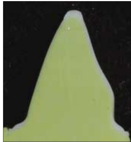
Fig. 3. Surface aspect after sectioning with buccolingual direction.