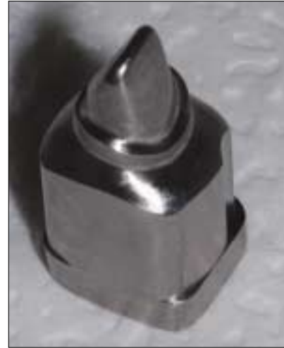
Fig. 1. Master models with Titanium Block made by using CAD/CAM system (Addtech Co., Seoul, Korea).

석고 모형은 3개의 시스템 (Cerasys system ® , KaVo Everest ® ,