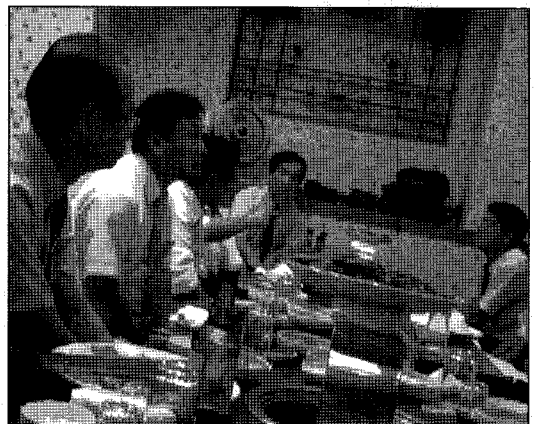
9월 위원장 회의장면