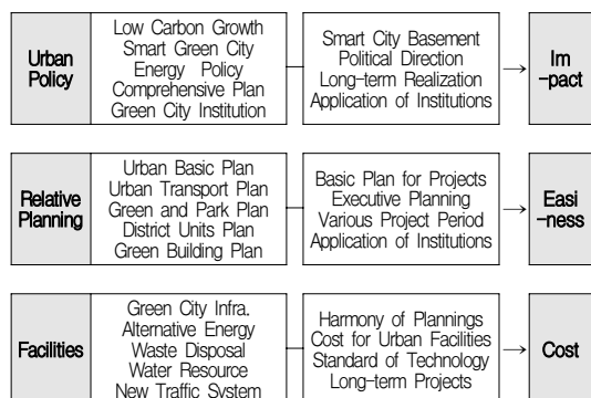
[Table 5] Evaluation Way for Development Element for Smart Green Multi Complex

이상을 종합해 볼 때 도시정책, 관련계획 및 기술수준과 관련된 계획요소의 평가수단들은 중국적으로 개발사업에 대한 영향성, 용이성 및 경제성 등 세 가지로 구분할 수 있다. 따라서 다음절에서는 이에 기초하여 스마트 그린 복합단지 계획요소의 발전방향을 평가하기로 한다.