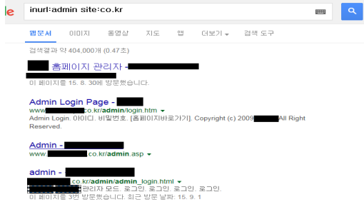
그림 3. 관리자 사이트를 검색할 수 있는 검색어 입력 결과 Fig. 3. Results keyword to search the manager site

실험 결과, 관리자 사이트 검색을 통해 가입된 회원들의 개인정보 리스트를 볼 수 있음을 확인할 수 있었다. (그림3[4])