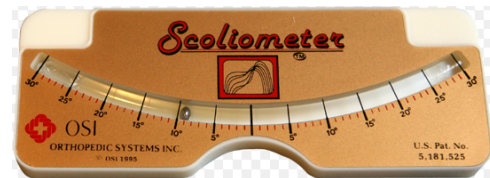
Fig. 1. Scoliometer

척추측만각도는 scoliometer(Mizuho OSI, MIZUHOSI baseline, USA)를 이용하여 체간회전각(angle of truncal rotation: ATR)을 측정하였다[Fig1]. 측정자제는 대상자의 등을 엉덩이 높이만큼 구부리며 앞으로 나란히 팔을 뻗어 양 손바닥을 마주대게 하였다. 연구자는 대상자가 허리를 90^\circ 구부린 상태에서 상위 흉추, 흉추, 흉요추, 이행부 및 요추부에서 늑골 돌출고(rib hump)를 관찰하였으며 scoliometer를 대상자의 척추 표면에 올려놓고 눈금을 측정하였다[16]. 연구원 및 조사원은 물리치료학과 교수에게 측정방법을 교육받고 훈련한 후 시행하였으며, 측정오차의 범위를 줄이고 측정방법을 통일하기 위해 대학생 37명에게 사전측정하였다. Gutknecht, Lonstein, Novacheck[17]의 지침에 따라 체간회전각이 6^\circ 이상이면 척추측만이 있는 것으로 분류하였다.