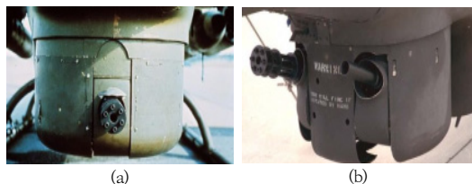
Fig. 4. Configuration of Turret (a) Configuration of XM-64 (b) Configuration of XM-28

특히, 1967. 11. 28부터 11. 30까지 텍사스의 포트 후드 및 포트워스에서 수행된 Part 3에서는 XM-28 터렛에 XM-134 기관총 2정을 장착한 형상으로 Table 7에 나타난 바와 같이 총 25개 시험조건에서 사격에 의한 제어 및 안전성 평가를 수행하였으며, 총 5쏘티(5.5H)의 비행시험과 7.62mm 기관총 탄약이 약 18,000R 사용되었다[10].