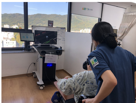
Fig. 1. HMD Based Rehabilitational Program using Virtual Reality (TionPlus)

본 연구에서 사용된 가상현실 프로그램은 3D 형태의 가상공간 콘텐츠가 내장된 TionPlus(아이티솔루션(주), 대한민국, 2018) 이다. TionPlus의 콘텐츠 구성은 먼저 K-MMSE 기반의 인지평가도구와 MVPT-K 기반의 시지각 평도구가 있는데, 인지훈련과 관련된 과제는 날씨, 계절, 지역, 장소 구분, 물건 이름 맞추기, 신분증 돌려주기 등 10개로 구성되어 있고, 시지각 훈련과 관련된 과제는 숫자 찾기, 도형 찾기, 색 영역, 지시한 물건 찾기, 얼굴 구분 등 24개 과제로 구성되어 있다. 훈련과 관련된 도구로 시장(메뉴 선택, 기억하기, 재료 담기, 계산하기), 마트(기호 식품 구매, 지시한 물건 찾기, 보기와 다른 물건 찾기 등), 집(거실, 욕실, 주방, 베란다 등 총 30여 개)으로 구성된 콘텐츠가 있다.