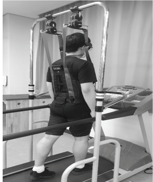
Fig. 3. Body weight support treadmill training.

체중지지 트레드밀훈련군은 FITEX(T-5050, 한신 스포츠산업, 한국), 체중부하 하네스는 SHUMA DA-2000 (㈜대안의료기, 한국)를 사용하여 훈련을 받았다. 체중지지 트레드밀훈련은 시작 전 부분 체중 부하 하네스를 착용한 후 안전 사고 예방을 위해 안전핀과 연결된 집게