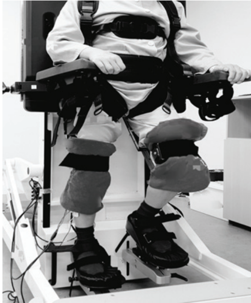
Fig. 2. Robot tilt-table training.