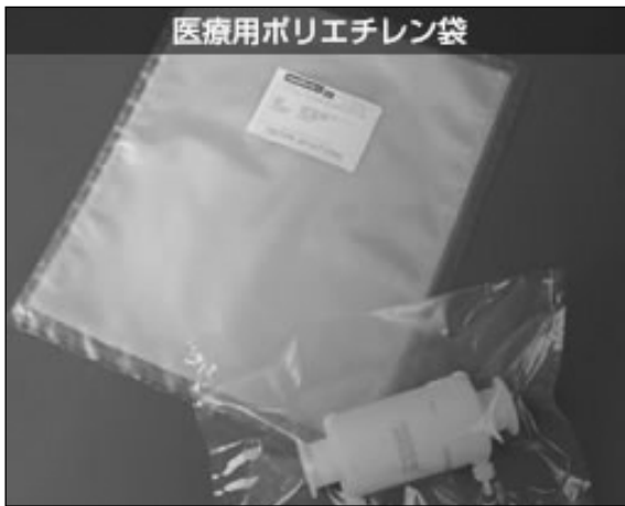
▲ 의료용 폴리에틸렌 백

HS 코드 3923.21은 에틸렌 중합체성 포장용 백으로 쌀 저장용 및 수송용의 포장용 백, 전해 알루미늄 콘덴서 포장용 방습 백, 일상생활에서 사용되는 폴리에틸렌 백(이하 PE 백), 재해 시 물을 운반하기 위해 사용하는 급수 백(3L 등), 의료용 PE 백 등 다양한 제품이 해당된다. PE 백 등은 가격경쟁력이 뛰어난 중국 제품이 많이 수입되고 있으며, 부가가치가 있는 의료용 PE 백 등은 한국에서도 수입되고 있다.